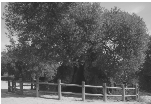
Olivera mil.lenària (Horta de Sant Joan)

Aquesta secció és un recull de les receptes de la tradició popular, de transmissió oral tal com ens han arribat, i per tant no suposa, en cap moment, un remei per a cap malaltia. Si esteu malats aneu al metge o personal qualificat.