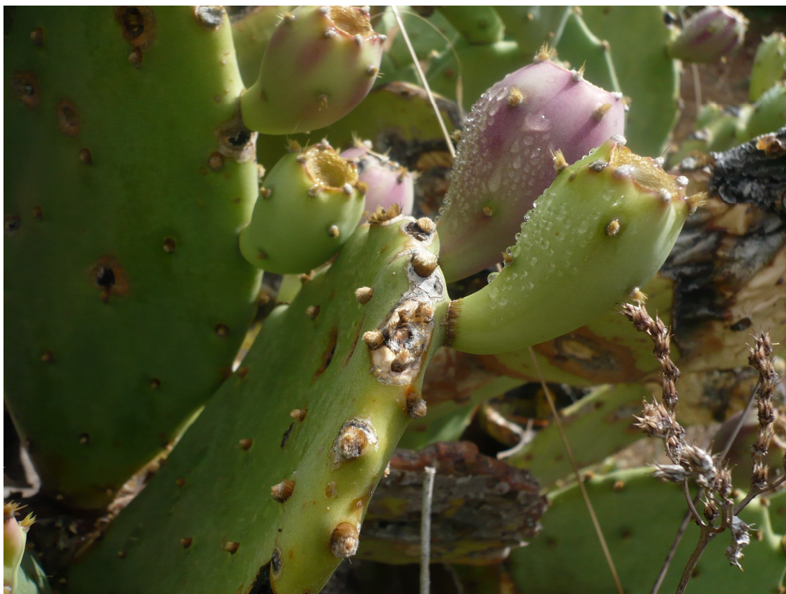
Opuntia Picus Indica